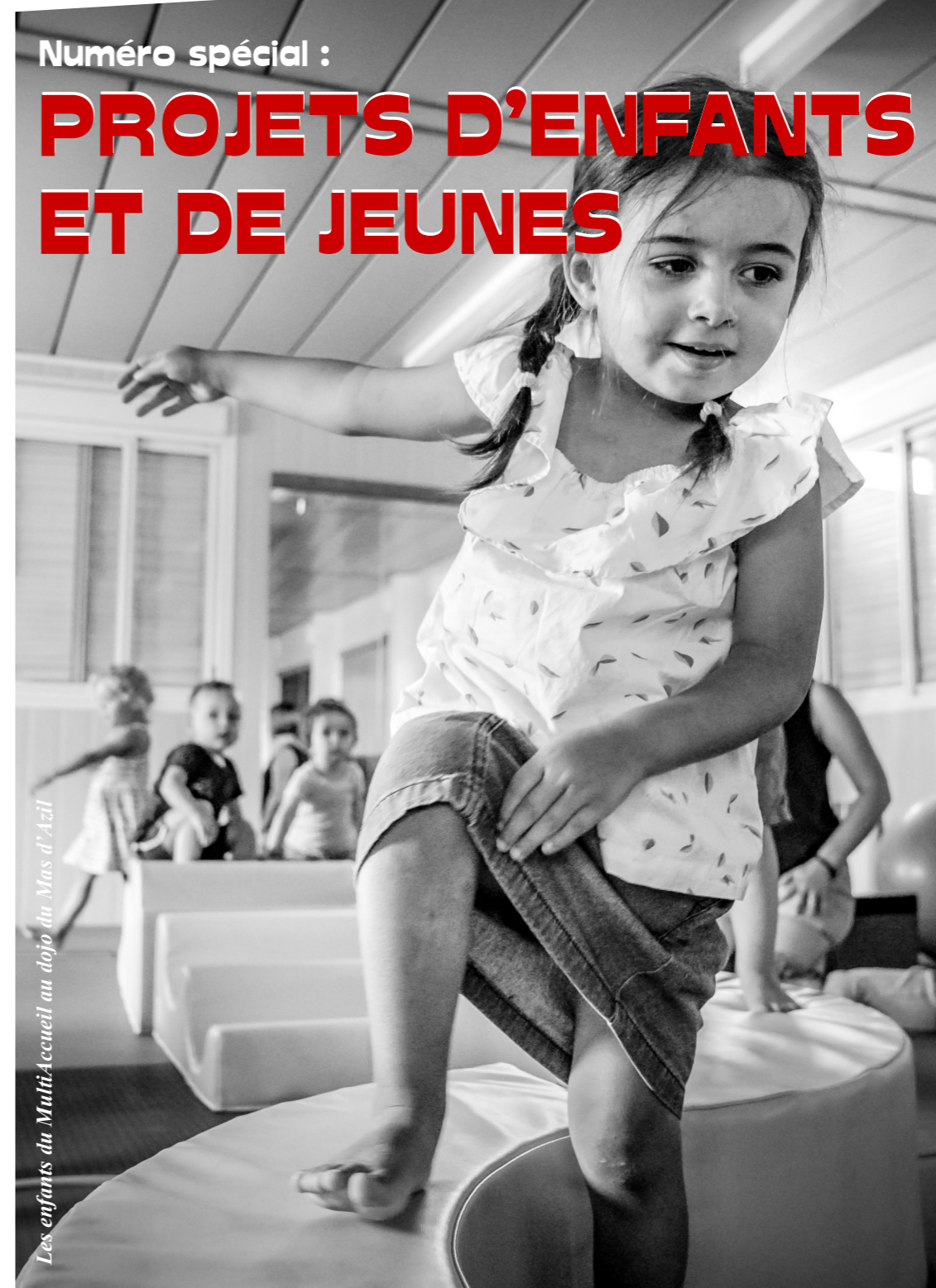
Les enfants du Multi-Accueil au dojo du Mas d'Azil